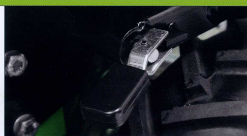
Stegole orientabili in altezza con bloccaggio rapido Height adjustable handle bars with quick clamping