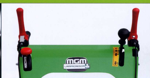
Comandi a console con sistemi di sicurezza integrati Console controls integrated safety system included