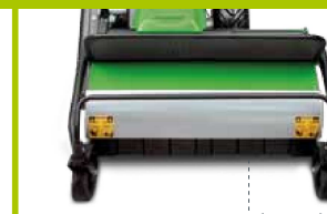
Camera di taglio decentrata Side cutting unit