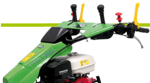
Comandi centralizzati a console con sistemi di sicurezza integrati Console controls integrated safety system included