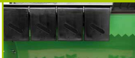
Guppo di taglio con controcoltello e bandelle oscillanti Cutting unit with oscillating safety protections and bottom blade