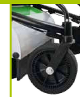
Bloccaggio ruote anteriori rapido con comando a console Front wheels brake easy to use