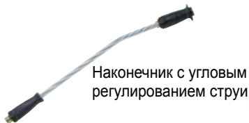
Наконечник с угловым регулированием струи