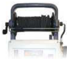
Наматыватель шланга со шлангом высокого давления 10 м (только для модели CLASSIC) 20 м (только для модели EXTRA)