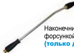
Наконечник с поворотной форсункой (только для моделей Extra)