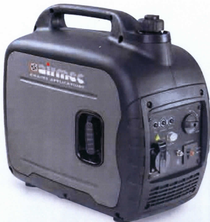
Versione LC 2000 I LC 2000 I version