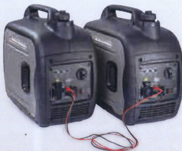
Versione LC 2000 IP collegabile in parallelo LC 2000 IP version connected in parallel

LED display pilot lamp e power indicator.