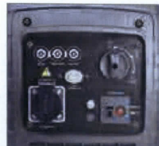
Versione LC 2000 IP LC 2000 IP version